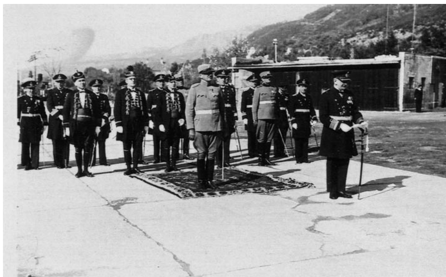
KAPETAN BOJNOG BRODA MIROSLAV STUMBERGER KAO KOMANDAT POMORSKE OBLASTI JUŽNOG JADRANA 1934. GODINE NA SVEČANOJ SMOTRI U KUMBORU