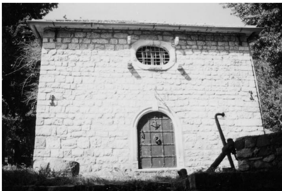
»DOM STAROG KAPETANA« U BAOŠIĆIMA