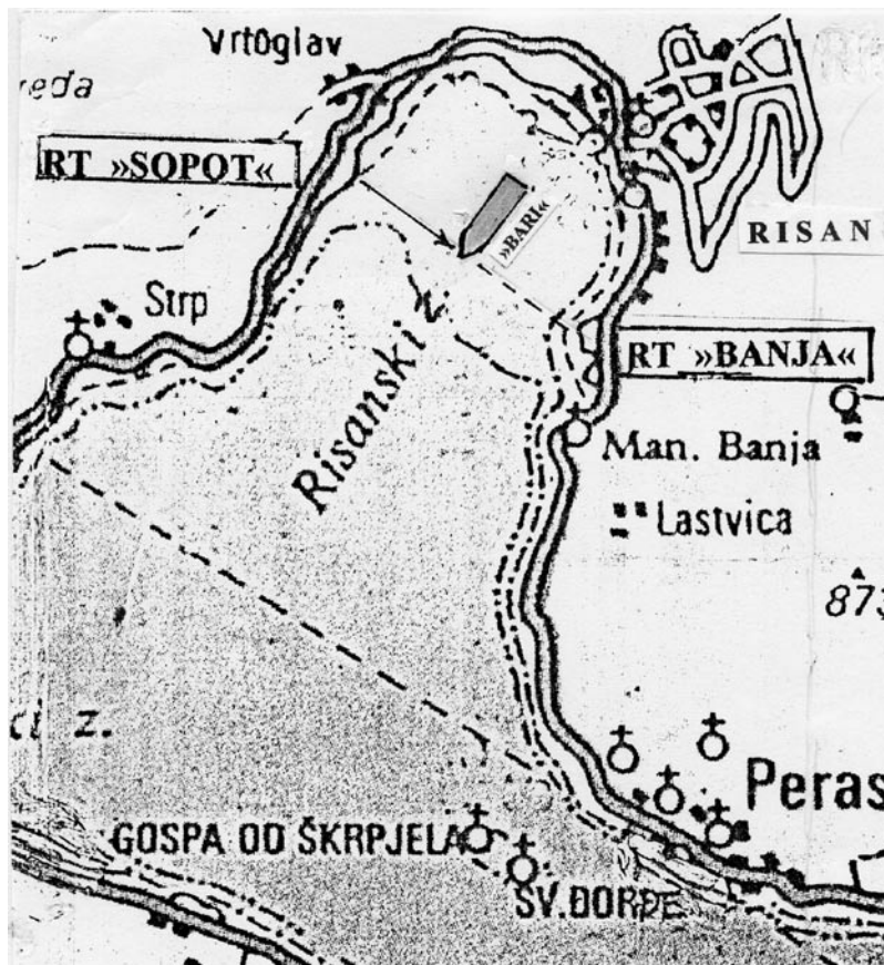
POLOŽAJ ITALIJANSKE KRSTARICE „BARI“ NA SIDRIŠTU U RISANSKOM ZALIVU 1942. GODINE