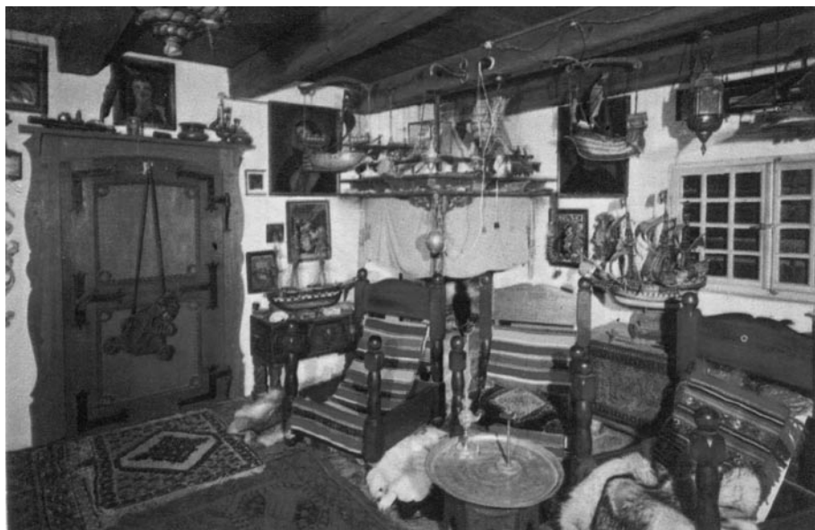
Muzej kapetana Štumbergefa • Baošići