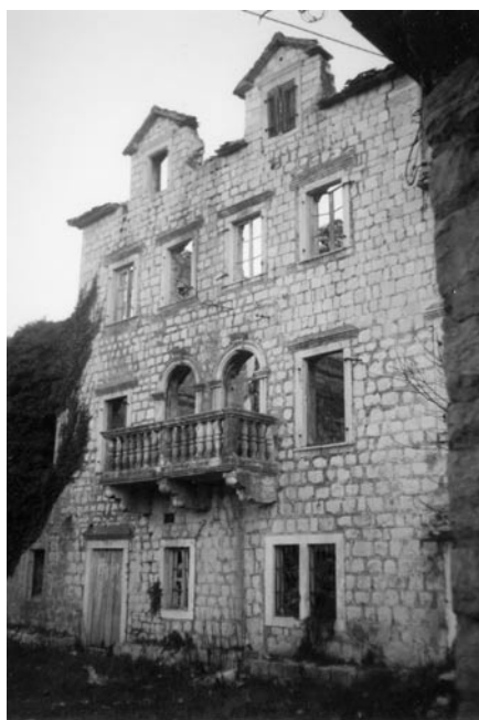
данашњи изглед некадашње палате Ивелић, у Рисну.