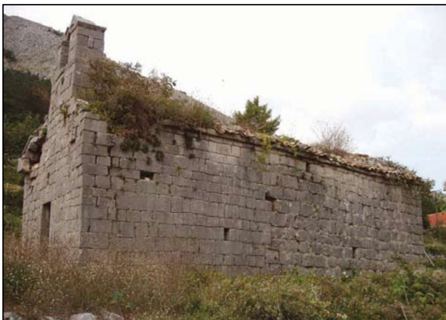
Сл. 5 Поглед на цркву са југозапада