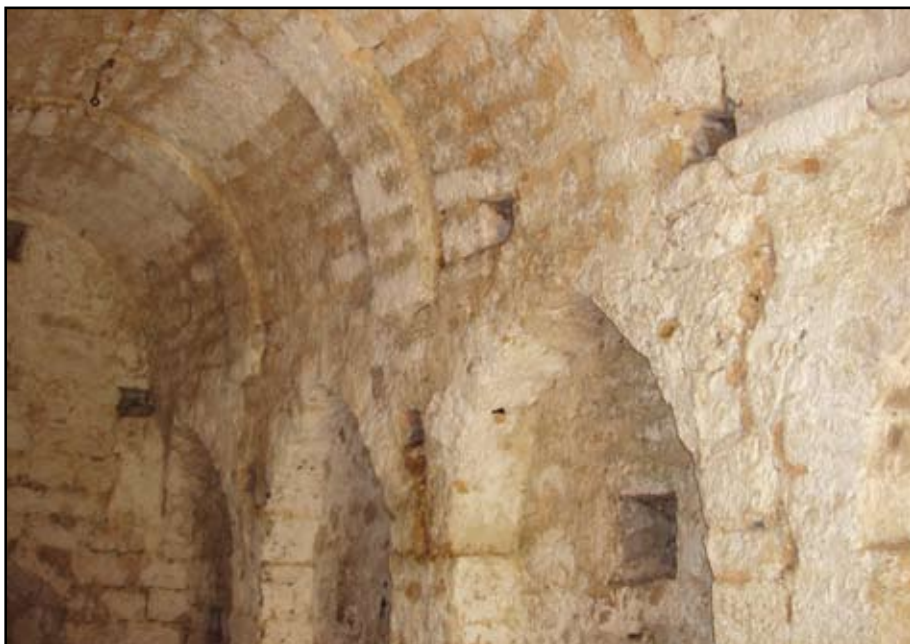
Сл. 12 Унутрашњост цркве, јужна страна свода из II фазе гра