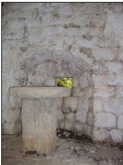
Сл. 13 Олтарски простор