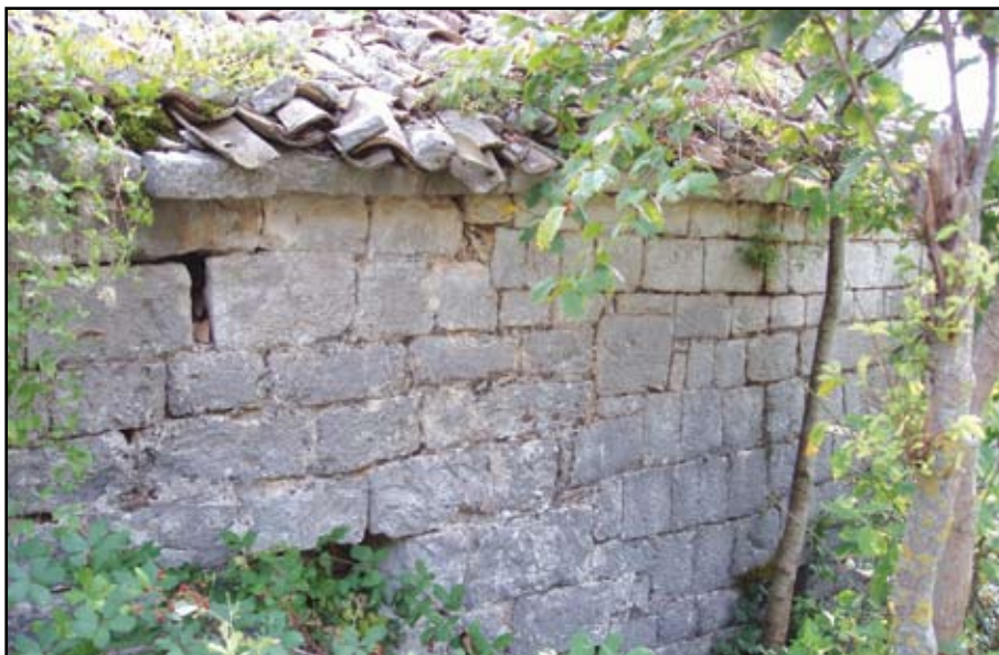
Сл. 15 Граница презиђивања између II и III фазе на сјевер