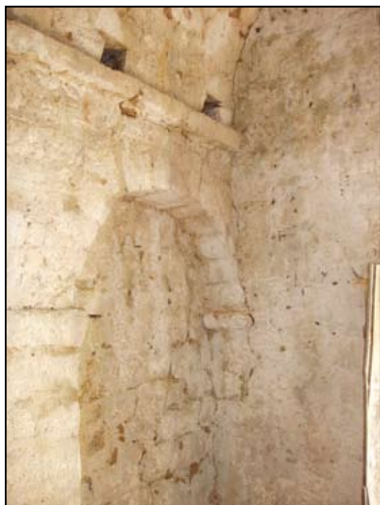
Сл. 14 Југозападни угао цркве (III фаза градње)