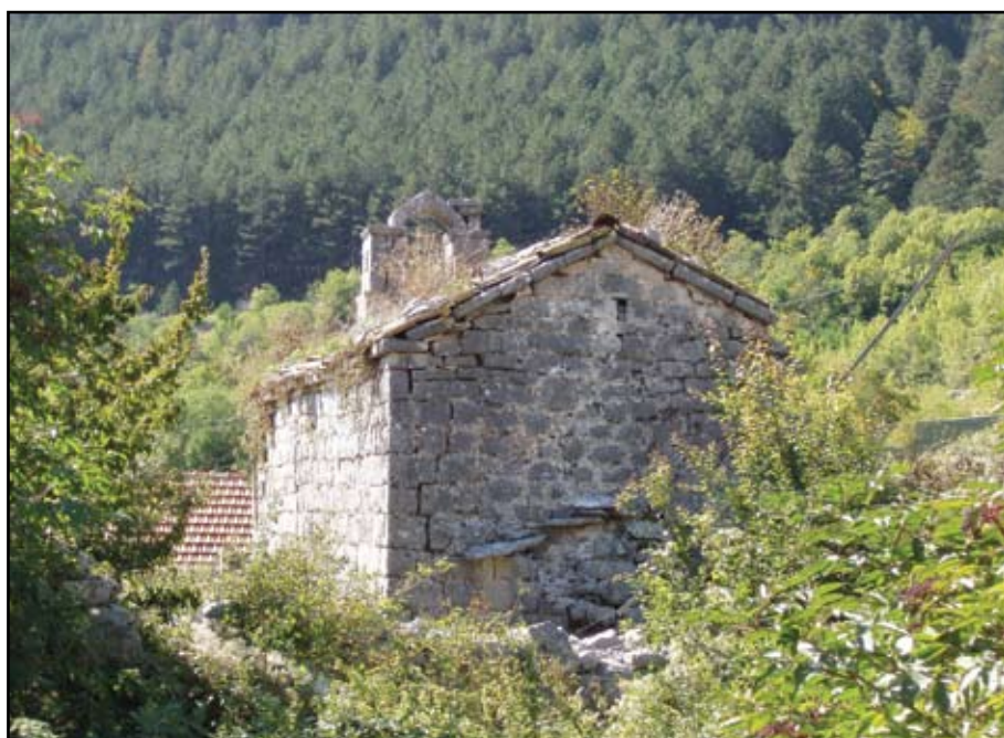
Сл. 6 Поглед са југоистока