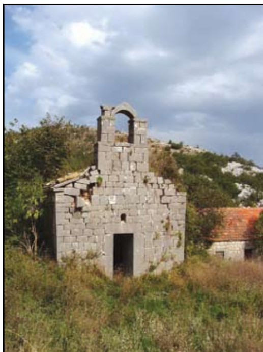
Сл. 4 Поглед на цркву са западне стране