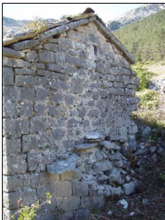
Сл. 10 Источна фасада са двије фазе градње