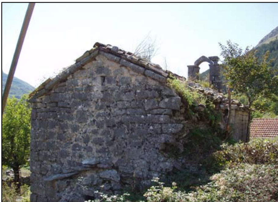
Сл. 7 Поглед са сјевероистока