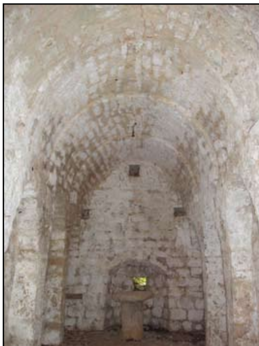
Сл. 11 Унутрашњост цркве