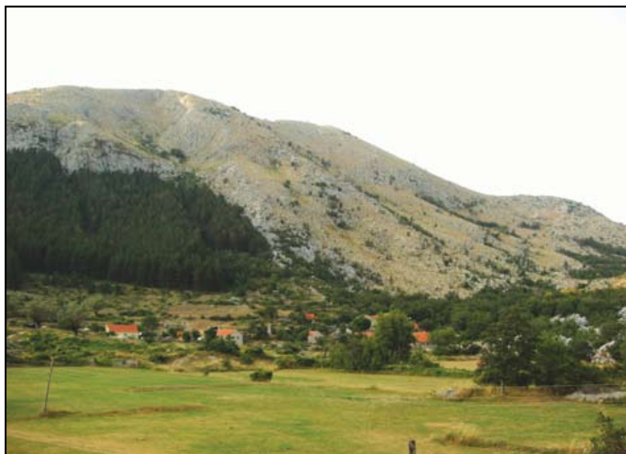
Сл. 1 Положај цркве у средишњем дијелу села Врбе