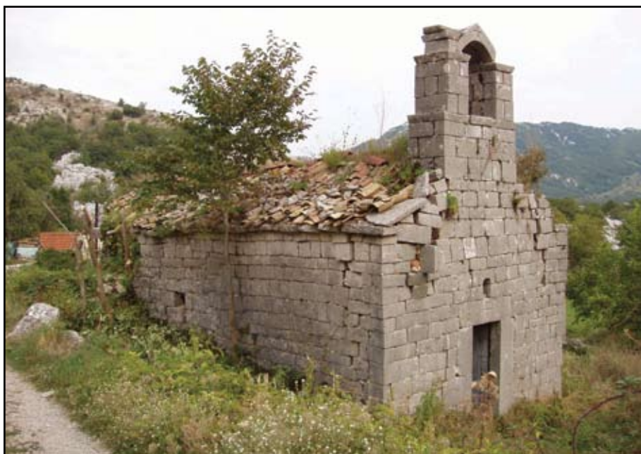
Сл. 3 Поглед са сјеверозапада