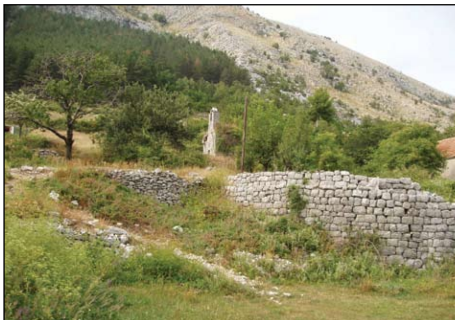
Сл. 2 Поглед на цркву и оближње гумно из поља