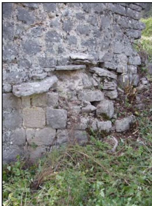
Сл. 9 Апсида првобитне цркве (I фаза градње)