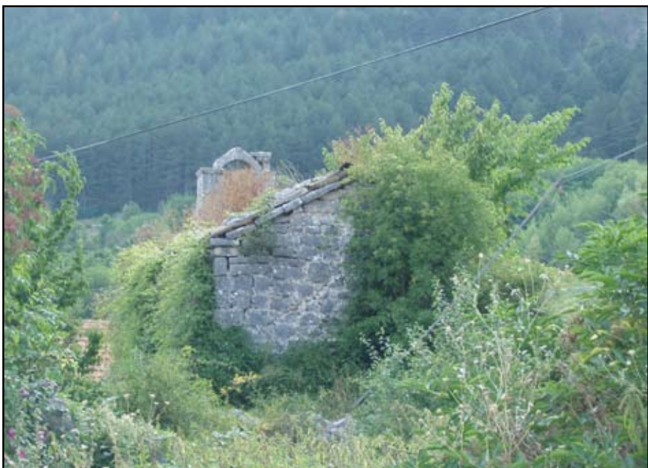
Сл. 8 Поглед на цркву прије уклањања вегерације