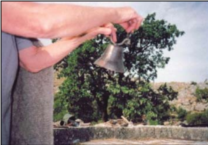
Сл. 4. Звонце за стоку и гумно, село Убалац, Горњи Ораховац. Снимио аутор текста, август, 2003. године

Младеж би излазила из кућа, обилазили су једни друге и скупљали се на гумнима. Момци су знали да се састану и да шарана јаја поставе уз зид неке куће, а онда да их новчићима гађају. Наравно, ко погоди јаје - добије га.