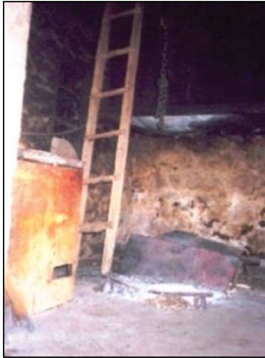
Сл. 2. Старо огњиште у кужини где је се својевремено налагао бадњак. Кућа Обрада Дабижиновића, село Убалац, Горњи Ораховац. Снимио аутор текста, август, 2003. године.

Домаћица донесе сламу и поспе је по кужини. По слами се седи и једе. Жене не смеју да додирују наложене бадњаке, не смеју ни да их прескоче те су, женска деца, седела подаље од самог огњишта. Док гори бадњак на огњишту се пече и пециво на ражњу.