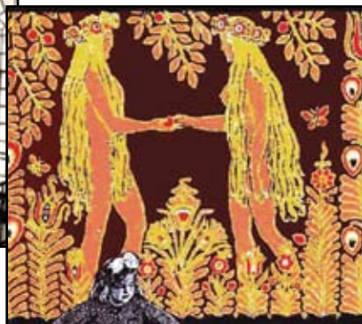
Zidne slikarije u Hotelu Plaža, Zelenika