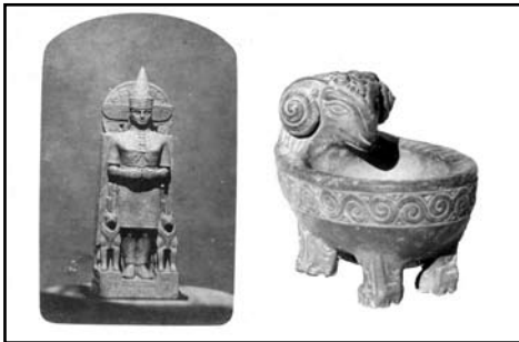
Dvije terakota-skulpture, rađene u Zelenici

Nekoliko godina pred svjetski rat, bile su Adorjanove najplodnije umjetničke godine. Oblikovao je jedan sasvim individualni stil. Prije svega kroz literaturu je zapazio originalnost naivnih ljudskih i scenskih prikaza po zapadnoj Mađarskoj. Sa druge strane, detaljno je proučavao dekorativne motive koje je narod primijenjivao u istočnoj Velikoj Niziji. Kombinacijom ovog, sa anatomski ispravnim ljudskim likovima počeo je stvarati zaista, fascinantne kompozicije, nezamjenjivo individualno prepoznatljive, dakle originalne. No, svi su ti radovi malog formata, akvareli sa tuš-obrisima, dovoljni samo za dekoraciju vlastitog stana i nikada nisu izlagani. Dakle nepoznati su. Dijelom su to originali za dopisnice, koji su – posredstvom Madarasove kćeri, objavljeni u Mađarskoj, za pomoć ratnim ranjenicima. Uz to ima i nekoliko pečenih skulptura od gline.