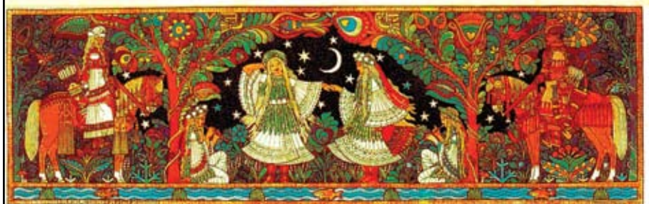
Hunor i Magor – Prvobitni karton i kasnije prepravljani akvarel