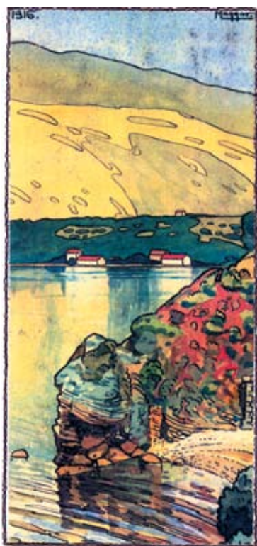
Pogled na Igalo iz Tople (1916)